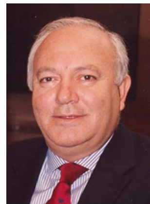
Miguel Ángel MORATINOS

Minister für Auswärtige Angelegenheiten Minister for Foreign Affairs Ministre des Affaires étrangères