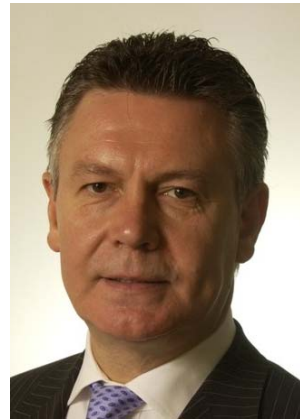
Karel DE GUCHT

Minister für Auswärtige Angelegenheiten Minister for Foreign Affairs Ministre des Affaires étrangères