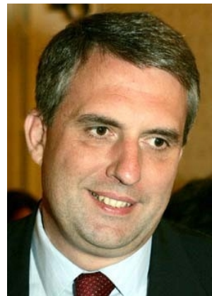
Ivailo Georgiev KALFIN

Minister für Auswärtige Angelegenheiten Minister for Foreign Affairs Ministre des Affaires étrangères