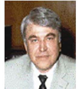
Georgi Petkov PETKANOV

Minister für Justiz Minister of Justice Ministre de la Justice