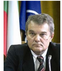
Rumen Yordanov PETKOV

Minister des Innern Minister of Interior Ministre de l'Intérieur