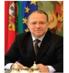
Alberto BERNADES COSTA

Minister für Justiz Minister of Justice Ministre de la Justice