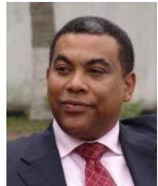
Olivier KAMITATU ETSU

Minister für Planung Minister of Planning Ministre du Plan