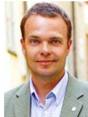
Sven Otto LITTORIN

Minister für Arbeit Minister of Labour Ministre du Travail