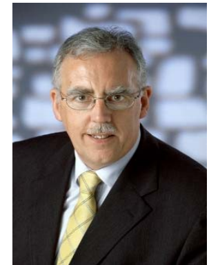
Tony KILLEEN, T.D.

Minister für Arbeit Minister for Labour Ministre de l'Emploi