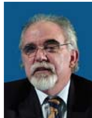
José VIEIRA DA SILVA

Minister für Arbeit und soziale Solidarität Minister for Labour and Social Solidarity Ministre du Travail et de la Solidarité sociale