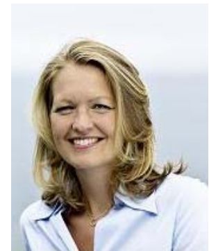
Eva Kjer HANSEN

Ministerin für soziale Angelegenheiten und Gleichstellung der Geschlechter Minister for Social Affairs and Gender Equality Ministre des Affaires sociales et de l'Égalité entre les femmes et les hommes