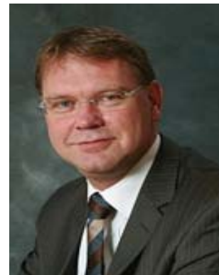
Aart-Jan de GEUS

Minister für Soziales und Beschäftigung Minister for Social Affairs and Employment Ministre des Affaires sociales et de l'Emploi