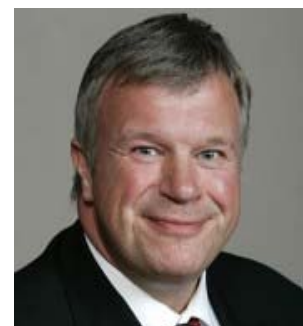
Bjarne Håkon HANSEN

Minister für Arbeit und Soziales Minister of Labour and Social Affairs Ministre du Travail et des Affaires sociales